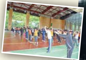
※スケジュールは一例です。